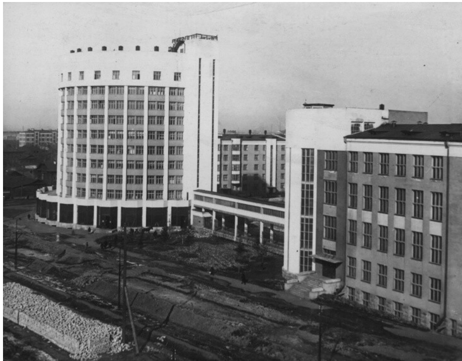
Иллюстрация 5. «Жилкомбинат НКВД». Дом гостиничного типа «Динамо» и дом культуры им. Дзержинского, связанные наземным переходом. Арх. Иван Антонов, Вениамин Соколов, Арсений Тумбасов и Александр Стельмашук, 1932г.

Отличительная черта домов-коммун – возможность получить доступ к необходимой инфраструктуре, не выходя из дома через систему наземных и подземных переходов