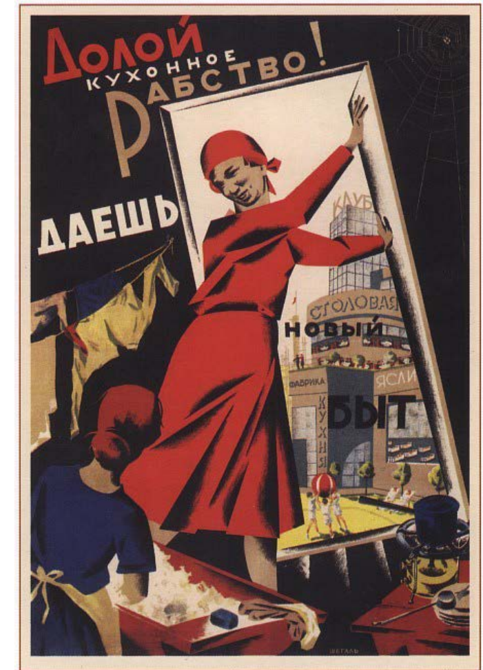
Иллюстрация 1. Плакат «Долой кухонное рабство – даешь новый быт!», Шегаль Г., 1931г.

Внедрение элементов коммунально-бытовых и культурно-досуговых помещений в жилые единицы решали важные социально-политические задачи