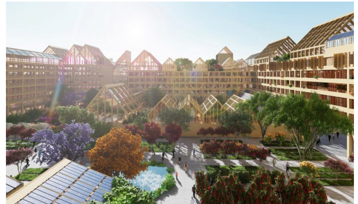
Иллюстрация 4. «Пост-ковидный» жилой массив, Арх. бюро Guallart Architects, проект, 2020 г., Сунъянь, Китай.