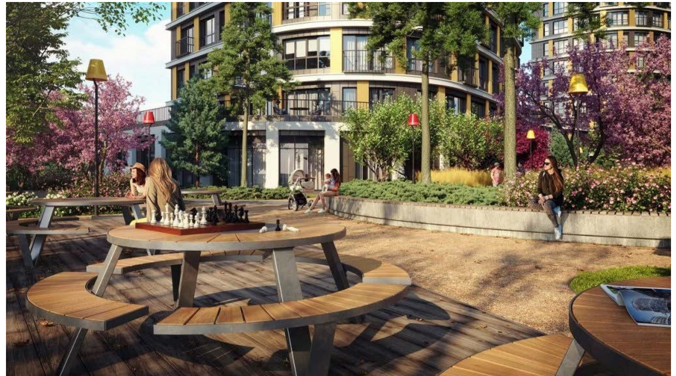
Иллюстрация 7. Комьюнити-центр во внутреннем дворе ЖК «Forum City». Архитектурное бюро «LEVS architecten», застройщик «Форум-групп», ландшафтная архитектура «S&P Architektura Krajobrazu».