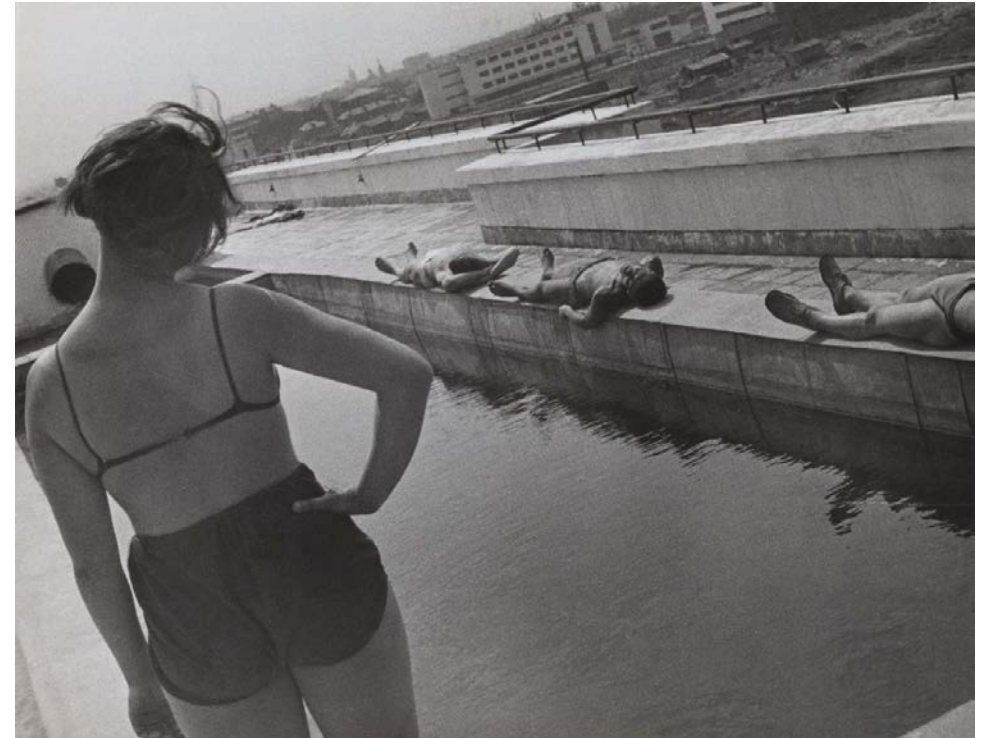
Иллюстрация 2. Солярий на крыше дома-коммуны. Фотограф Александр Родченко, 1932 г. Из частной коллекции. Источник: https://strelkamag.com