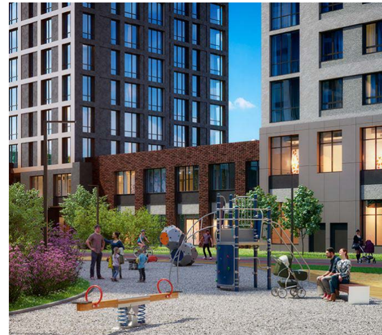
Иллюстрация 6. Жилой комплекс «Парк Столиц». Связь жилых секций через торговую галерею и внутренний двор. Застройщик «АтласДевелопмент». 2021г.

Связи жилых корпусов комплекса с торговой и общественной частью через пешеходные галереи или закрытые стилобатные площадки.