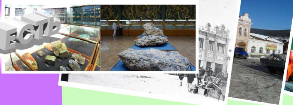
Музей Ильменского заповедника